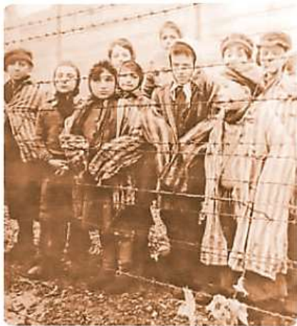
Fig. 2.28 Nadie estaba exento. Los nazis pretendían exterminar a los judíos. Niños y mujeres, dentro de un campo de concentración.

A quien se propuso exterminar el Régimen Nazi.