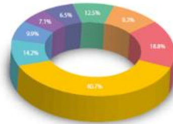
Gráfica 2.7 Razones por las que los hombres dejan de estudiar