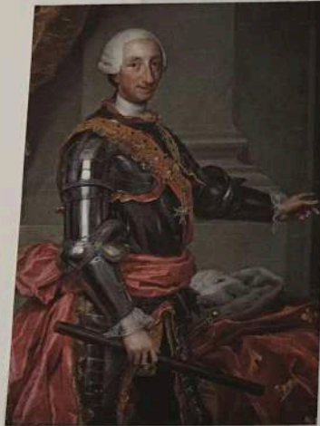
FIG. B2.C2.4. Carlos III de España, principal impulsor de las reformas borbónicas (pintura de Anton Rafael Mengs, 1761, Museo Nacional de Ciencias Naturales, Madrid).

nueva corriente ideológica conocida como Ilustración , la cual surgió en Europa en el siglo XVIII. La Ilustración veía en la razón un instrumento para mejorar la vida humana, por lo que representó un gran avance de las ciencias y la filosofía.